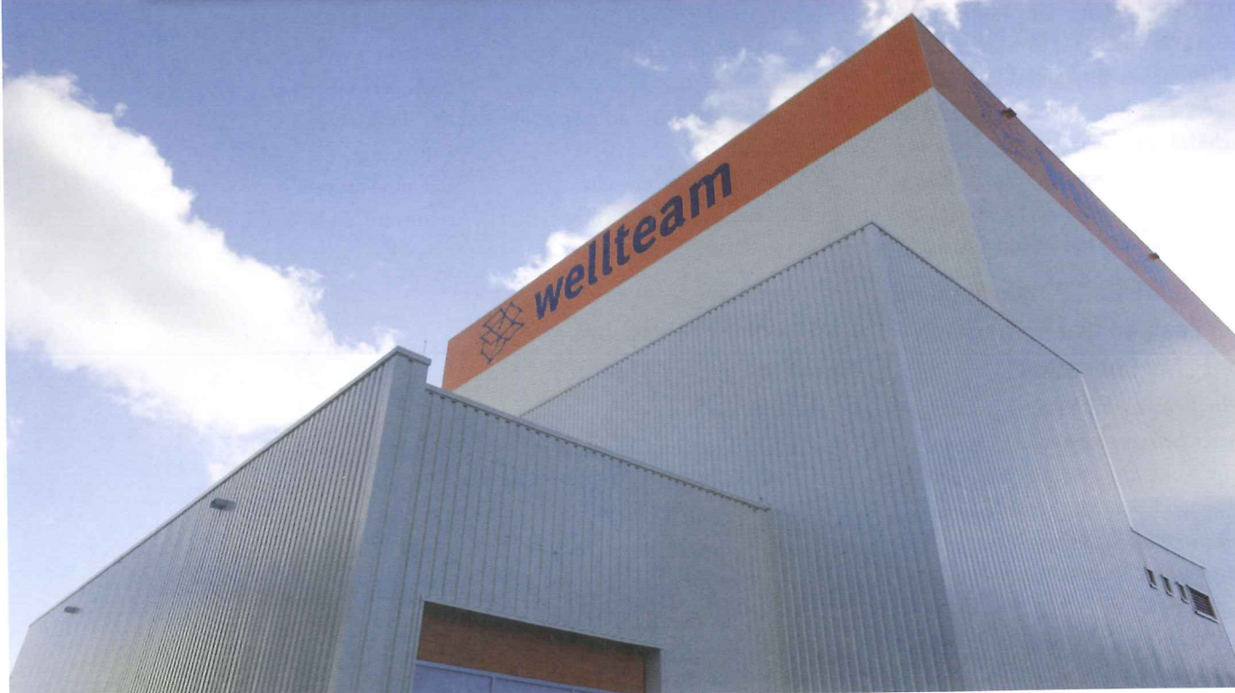
Vor einem Jahr wurde mit dem Bau des neuen vollautomatischen Hochregallagers der wellteam-Firmengruppe in Herford begonnen.